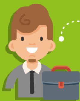
Bénéficiaire du contrat pro