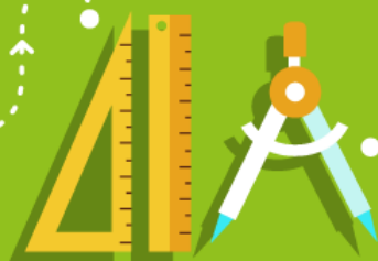
Parcours de formation sur-mesure